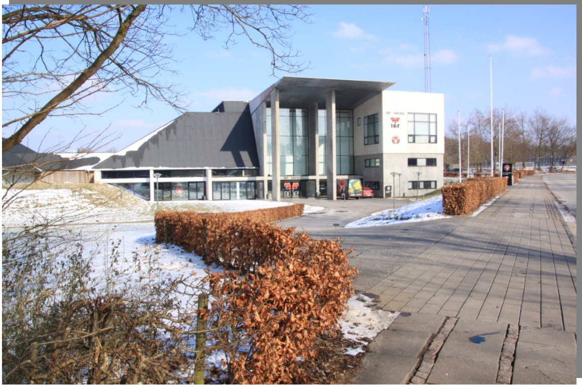
Ikast Brande Arena