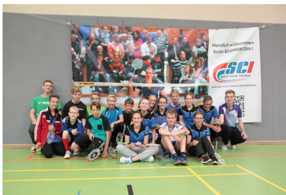
Abbildung 2: Teilnehmerfeld U15 und U17