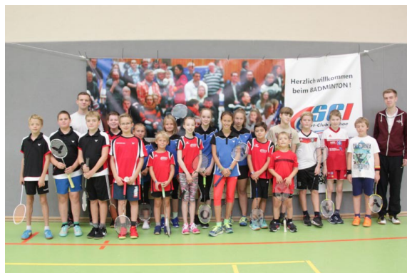
Abbildung 1: Teilnehmerfeld U11 und U13